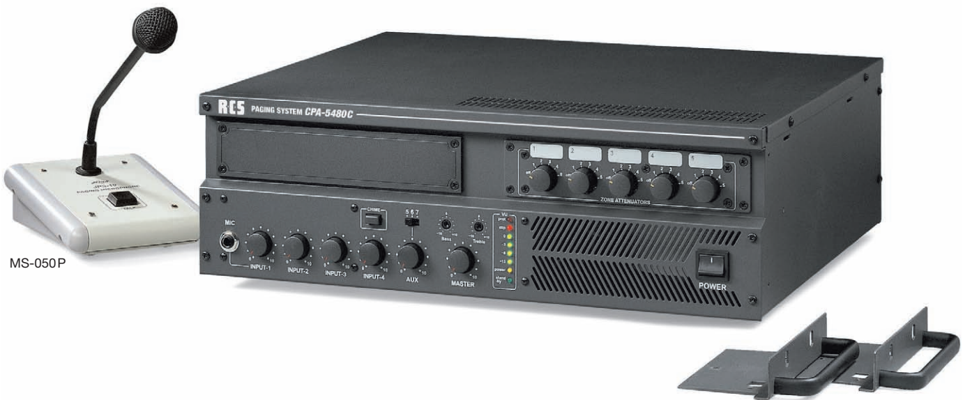
19"-Montagewinkel sind im Lieferumfang enthalten.